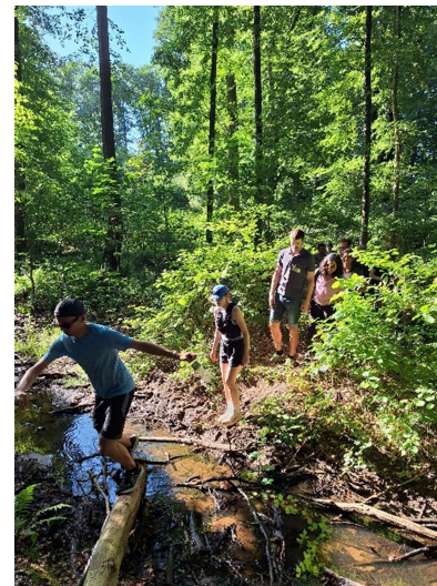
Wanderung durch das Naturschutzgebiet der Dingdener Heide