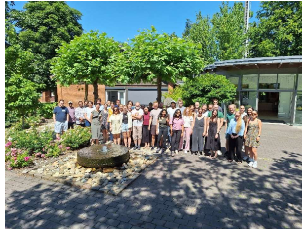
Teilnehmende bei 36°C Lufttemperatur